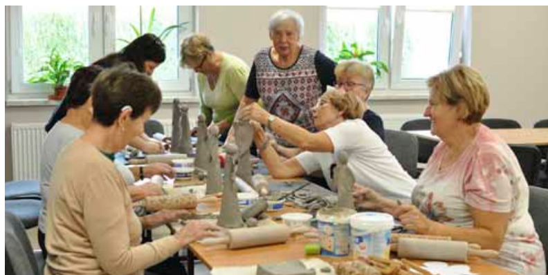
Zajęcia plastyczne – ceramika