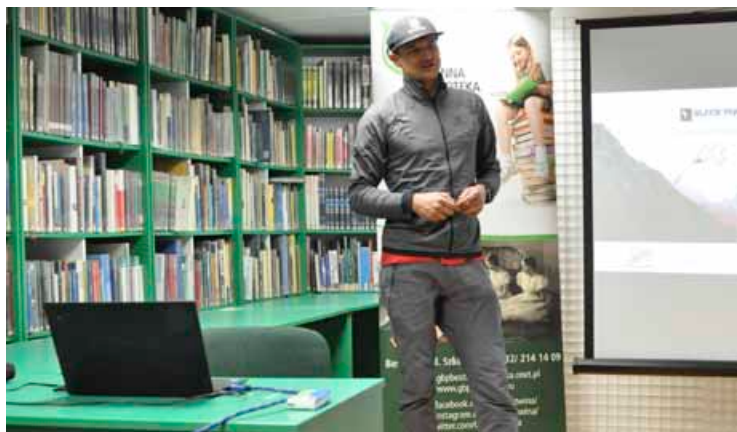
Himalaista Adam Bielecki

Jeśli przed spotkaniem z Adamem Bieleckim ktoś nie wiedział, czym różni się styl alpejski od obłączniczego albo gdzie jest największe na świecie zagęszczenie ośmiotysięczników, nadrobił te braki w jeden wieczór. Być może niejeden z słuchaczy zachęcony opowieściami Bieleckiego wybierze się w góry – niekoniecznie od razu w Himalaje, ale tam, gdzie pozwoli mu kondycja i umiejętności. Pora na przygodę!