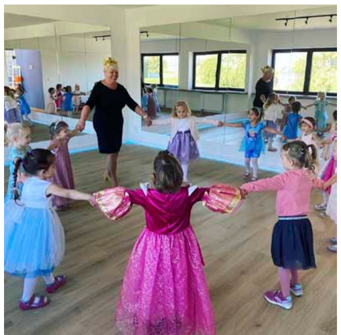
Zajęcia dla najmłodszych

Działalność „Bazy na Krakowskiej” dzieli się na dwie części. Pierwsza z nich, edukacyjna , obejmuje opiekę nad dziećmi w wieku 6–14 lat. Projekt „Mamo, tato jedź i załatwiał” dla naj-