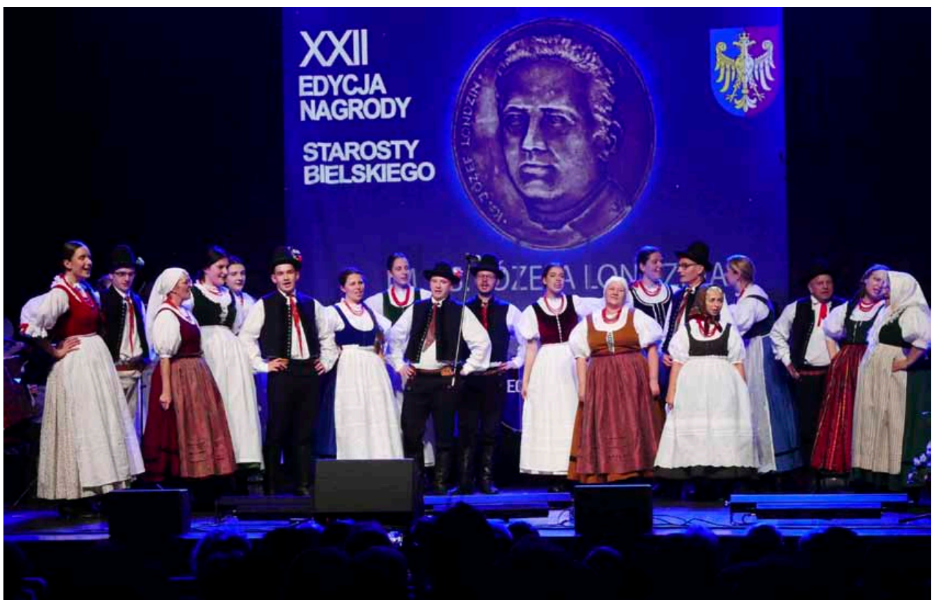
Zespół „Bestwina” na scenie BCK