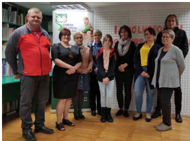
Laureaci konkursu poetyckiego

25 października w Gminnej Bibliotece Publicznej w Bestwinie ogłoszono wyniki I Ogólnopolskiego Konkursu Poetyckiego „W górach”, na który wpłynęło 46 wierszy z całej Polski.