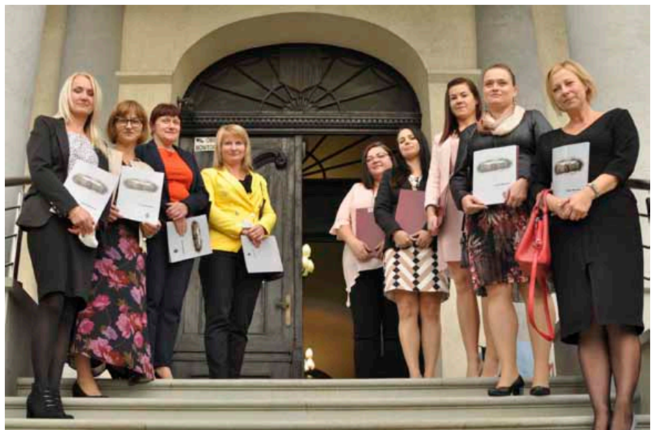
Nauczyciele z gminy Bestwina – awanse zawodowe

W dalszej części obrady przebiegały już zgodnie ze standardowym porządkiem. Sprawozdanie z działalności międzysesyjnej złożył wójt Artur Beniowski : 1. Trwa budowa chodnika przy ul. Janowickiej w Janowicach. 2. Tegoroczna msza dożynkowa miała miejsce w kościele św. Józefa Robotnika w Janowicach. 3. 5 października odbyły się wybory Zarządu Gminnego OSP – prezesem został Zygmunt Łukoś. 6. Regionalny Zespół Pieśni i Tańca „Bestwina” obchodził 50-lecie powstania, w części oficjalnej uczestniczył wójt razem z przewodniczącym Jerzym Stanlikiem . 7. W Bestwinie rozegrano wojewódzki „Turniej Piłkarskich Janków”, dotychczas organizowany na Stadionie Śląskim. 8. Kończy się remont elewacji Muzeum Regionalnego w Bestwinie. 9. Został rozstrzygnięty przetarg na odbiór odpadów komunalnych w przyszłym roku. Jeśli nie wzrosną ceny najczęściej oddawanych frakcji, istnieje duża szansa zamieszczenia się w kwocie płaconej dotychczas od jednego mieszkańca. 10. W Bestwinie zorganizowano punkt szczepień przeciw COVID-19.