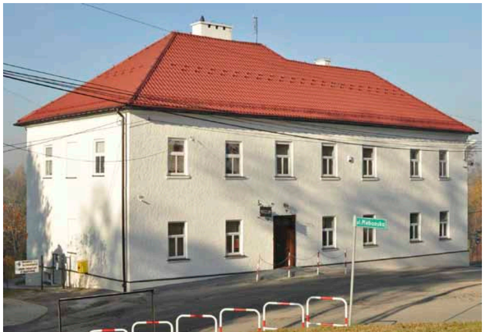
Muzeum Regionalne im. ks. Zygmunta Bubaka

Od sierpnia do października w Muzeum realizowano projekt unijny z Europejskiego Funduszu Rolnego na rzecz Rozwoju Obszarów Wiejskich (PROW na lata 2014–2020). W jego ramach wykonano renowację elewacji polegającej na częściowej wymianie odparzonych tyn-