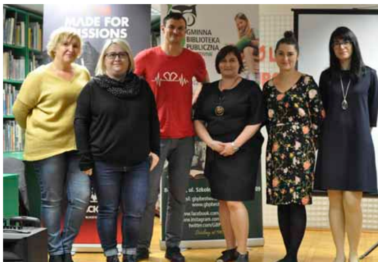
Z pracownikami GBP w Bestwinie