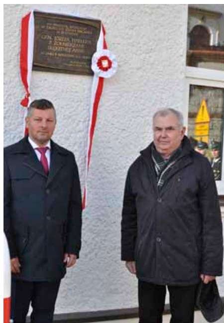
Odsłonięcie tablicy pamiątkowej