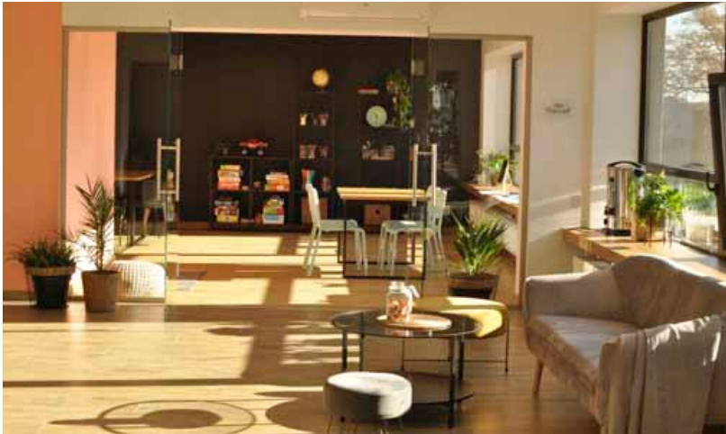
Przytulne wnętrze „Bazy na Krakowskiej”

młodszych w wieku 3–5 lat i zajęcia świetlicowe dla starszych zapewnią atrakcyjne formy zajęć i towarzystwo rówieśników. Dzięki projektowi „Rodzice na wychodnym” można zaplanować wieczorem randkę we dwoje, nie martwiąc się o to, kto przypilnuje latorośli. Z kolei kulturalna działalność placówki kon-