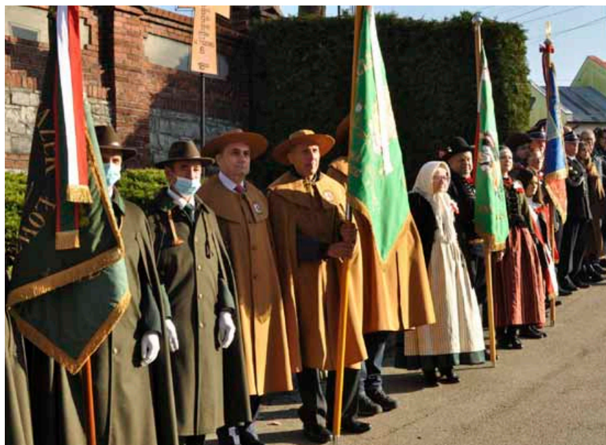
Poczty sztandarowe i mieszkańcy gminy Bestwina