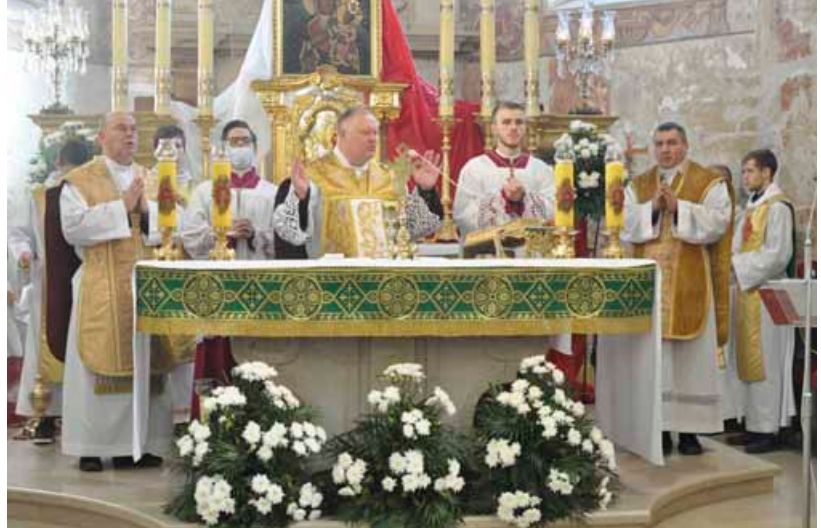
Msza św. w kościele Wniebowzięcia NMP w Bestwinie