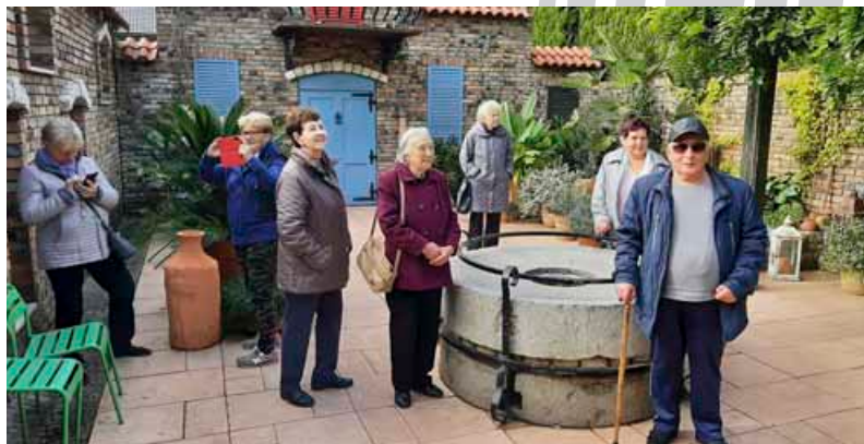
Wycieczka do ogrodów „Kapias”