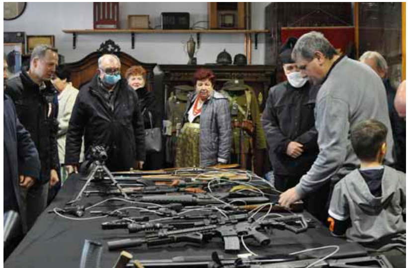
Wystawa broni i umundurowania